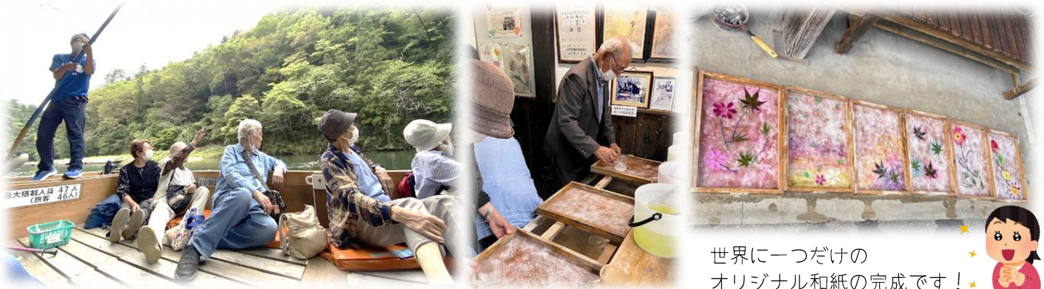
世界に一つだけの オリジナル和紙の完成です！

また、船下りの後には東山和紙紙すき館で紙すき体験を行い、個性豊かな素敵な和紙を作りました。完成したものが届くのが楽しみです。お天気が心配されましたが、暑くもなく寒くもなくちょうどいい気候で過ごしやすく、久しぶりの遠足を皆さん堪能して「楽しかった～」という声を聞くことができました。