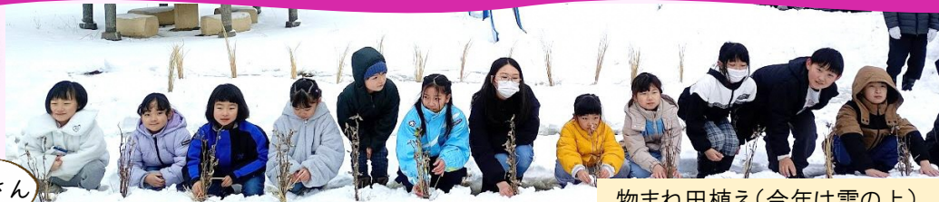
物まね田植え(今年は雪の上)