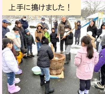
上手に搗けました！