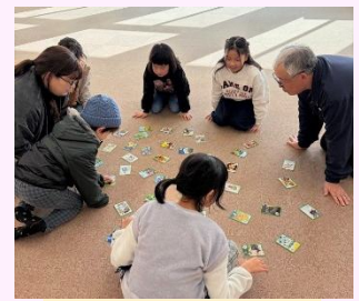
白熱のかるた大会