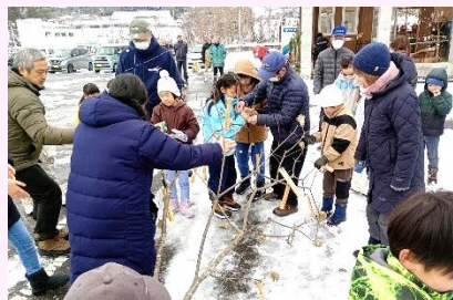
粟穂・夕顔の花ならし、成木責め

★どなたでも参加できる行事です！体験してみたいという方は来年の小正月までお待ちくださいね！