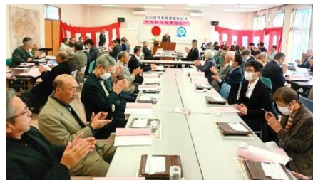
約80名の方々にご参加いただきました！