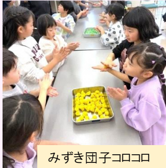
みずき団子コロコロ