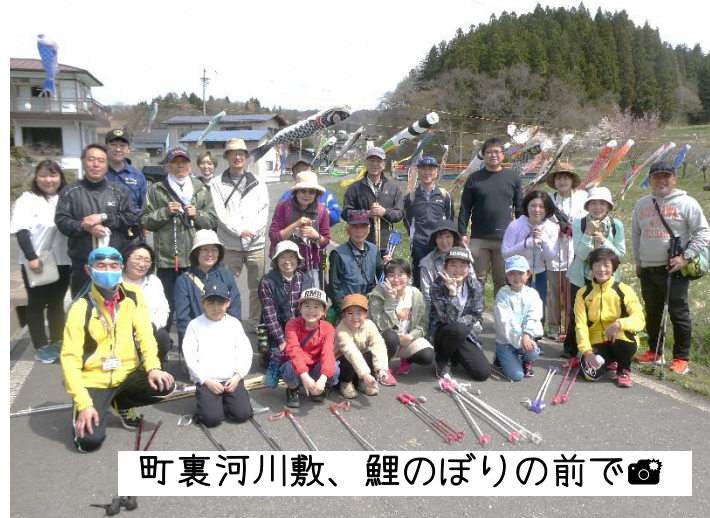
町裏河川敷、鯉のぼりの前で📷

町裏河川敷では、地区の皆さんが『明るさと活気をもたらしたい』と掲揚された34匹の鯉のぼりと満開の桜並木を見て元気をいただきました。コロナ禍で約2年ぶりに開催された大会でしたが、「久しぶりに皆でウォーキングができて楽しかった」と大好評でした。