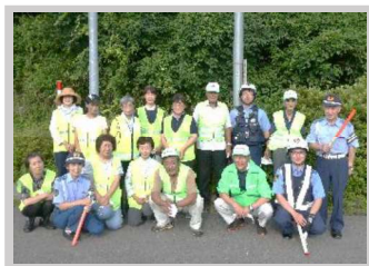
【7月】交通安全母の会 『チューインガム作戦』