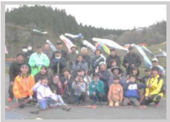
【4月】生涯学習部 『春のお花見ウォーキング』