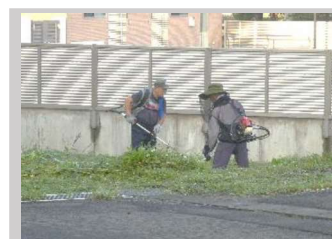
【8月】梁川振興会 『秋の環境整備』