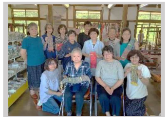
【7月】女性部 『役員研修さき織り体験』