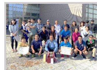
【11月】体育振興部 『江刺地区内駅伝』