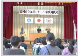
【4月】開校式 『江刺ひがし小学校開校』

主な出来事につきましては、次の月別催しのとおりです。ご理解ご協力ありがとうございました。コロナウイルスが早く終息され、平常通りの活動ができますように、また来年もよろしくお祈りします。