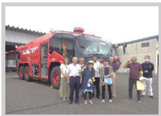
【7月】地域安全部 『役員研修会』