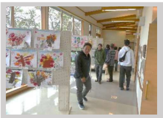
【10月】梁川振興会 『梁川地区文化祭』