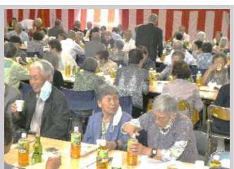
【9月】梁川振興会 『梁川地区敬老会』