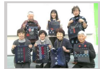
【12月】生活環境部 『古布再生研修会』