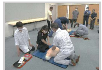
【8月】梁川振興会 『自主防災研修会』