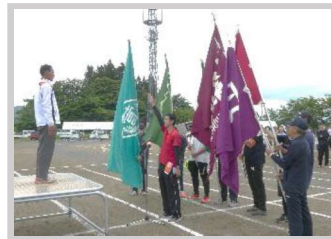
【6月】体育振興部 『梁川地区民運動会』