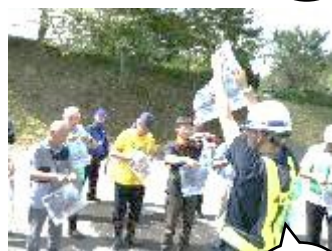
【8月】梁川振興会 『自主防災研修会』