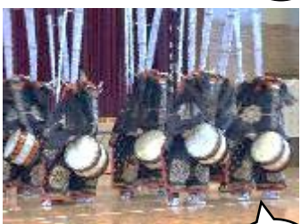
【10月】生涯学習部 『郷土芸能発表会』