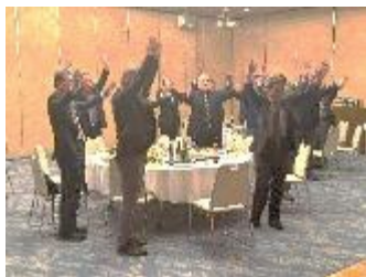
【4月】梁川振興会 『令和7年度歓送迎会』

令和8年も、皆さまのご支援ご協力を賜りながら、より一層活躍の場を提供できるよう努めてまいります。来年もどうぞよろしくお願いいたします。