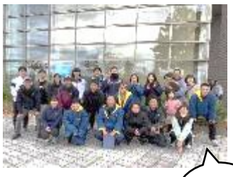
【11月】体育振興部 『江川区内駅伝』