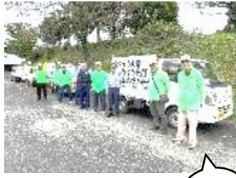
【10月】地域安全部 『地域安全パレード』