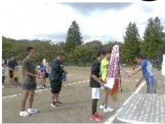
【10月】体育振興部 『第3回リレマラソン』