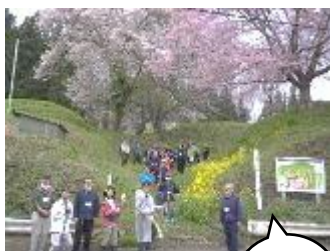
【4月】生涯学習部 『まちアカ散歩』