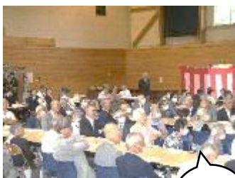
【9月】梁川振興会 『梁川地区敬老会』