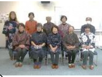
【11月】生活環境部 『古布再生講習会』