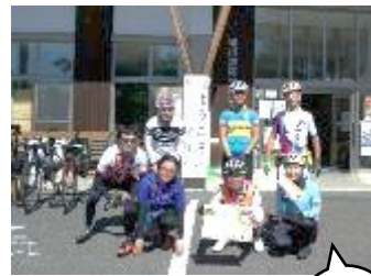
【9月】梁川振興会 『Giro'd ESASHI開催』