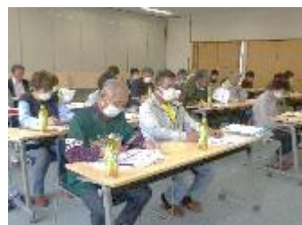
【5月】社会福祉部 『ご近所福祉スタッフ研修会』