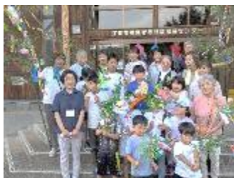
【7月】梁川振興会 『放課後子ども教室七夕』