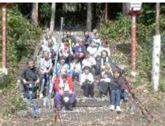
【9月】生涯学習部 『秋の歴史探訪ウォーキング』