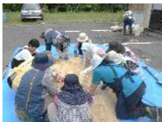
【6月】生活環境部 『EMボカシつくり講習会』