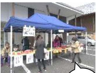
【10月】梁川振興会『梁川地区民文化祭』