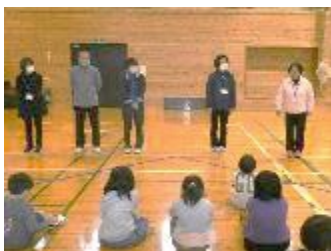
【4月】梁川振興会 『放課後子ども教室開所式』