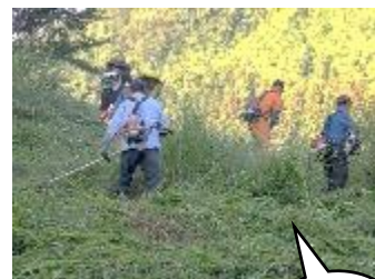
【8月】梁川振興会 『秋の環境整備』