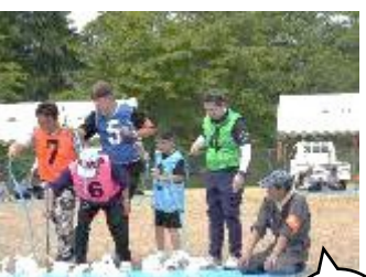
【6月】梁川振興会 『梁川地区民運動会』