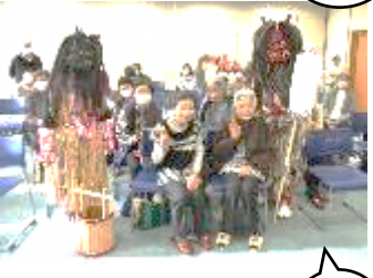
【12月】社会福祉部 『ふれあい交歓会』