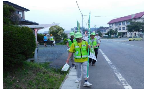
防犯パトロールする生活安全部の皆さん