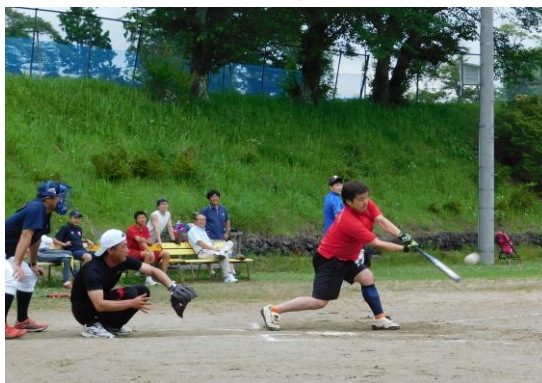
連合チームの対戦

※8月25日(日)は「第55回地区民運動会」が行われます、当日は厳しい暑さが予想されますので、十分な熱中症対策をして楽しい地区民運動会にしましょう!(荒天の場合は中止となります)