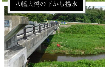
八幡大橋の下から揚水