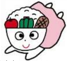
奥州市食育キャラクター わんパクション