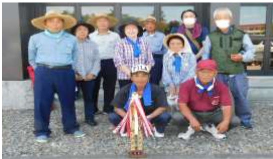
優勝した 6区チーム

7月18日(日)「第17回グラウンドゴルフ大会」が開催されました。いつもより早い梅雨明けの暑い中、約60名の方が参加し白熱した戦いが繰り広げられました。結果はごらんのとおりです。