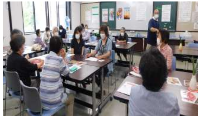
～地区センターからのお知らせ～

7月8日(木)に第1回「思い出カフェあつぷる」が、20名の方に参加頂き広瀬地区センターで開催されました。ゲーム・お話などで和やかに過ごすことが出来ました。地域の皆さん誰でも参加出来ますので、お気軽に参加してみてください。※次回開催日は9月9日(木)です、参加希望の方は、2日前までにお電話で申込みください。申込先 地域包括支援センターえさし中央 ☎34-4826