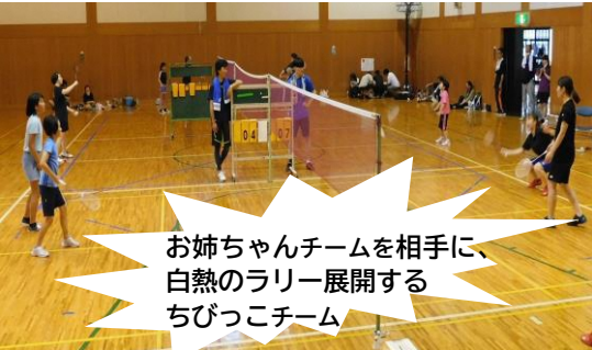
お姉ちゃんチームを相手に、白熱のラリー展開するちびっこチーム