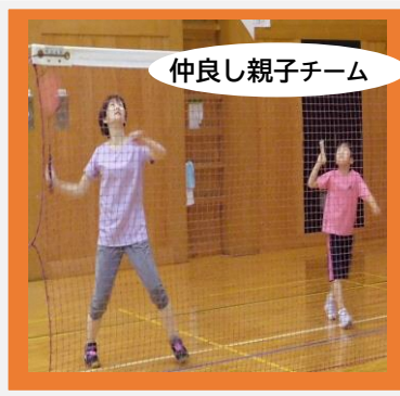
仲よし親子チーム