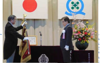
閉校式での校旗返納

児童や教職員、関係者が 150 年にわたり地域と共に学んだ学び舎への感謝と別れを告げ、輝かしい歴史と伝統に幕を下ろしました。4 月からは開校する「江刺ひがし小学校」で新たな歴史を刻むことになります。