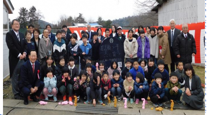
閉校記念碑を囲んで広瀬小児童と関係者の皆さん