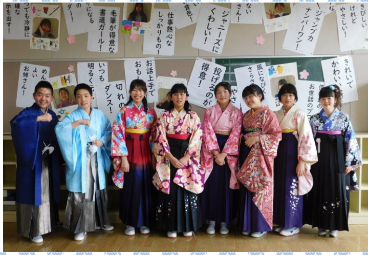
旅立ちの春 8名の卒業生たち「思い出の教室にて」