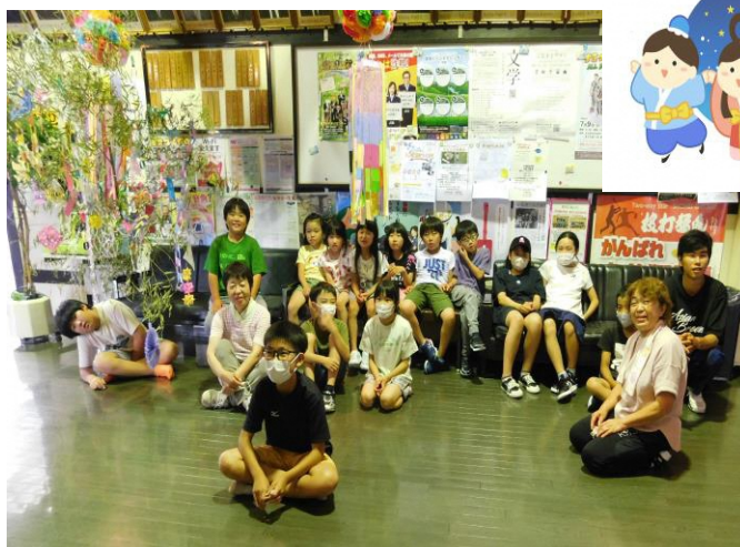
七夕飾りを楽しむ子ども教室の皆さん

今年も広瀬地区センターのホールと玄関前 に、子ども教室の皆さんで七夕を飾ってくれ ました。輪つなぎ飾りや折り紙の天の川、短 冊には「お金が、がっぼがっぼになりますよ うに」「けいたいほしい」「しゅくだいがな くなりますように」「おかあさんが、けんこう でいられますように」「宝くじがあたりますよ うに」などそれぞれに願い事が書かれていま した。館内を彩ってくれてありがとう。