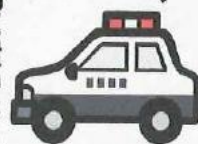
奥州警察署管内の交通事故発生状況 (令和元年8月末現在)