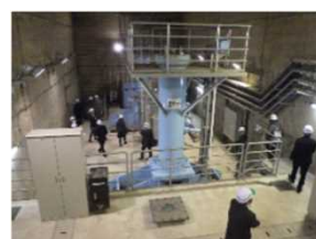
利水放流バルブ室