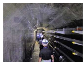
堤体内部（約800m、階段有）