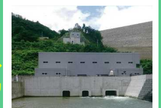
発電所（胆沢第一・第三）