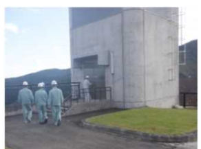
エレベータで堤体内部へ