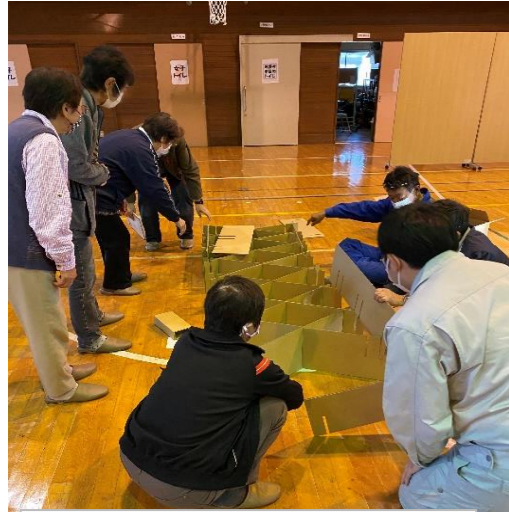
①段ボールベッドの作り方パーツを出して広げてみたが...