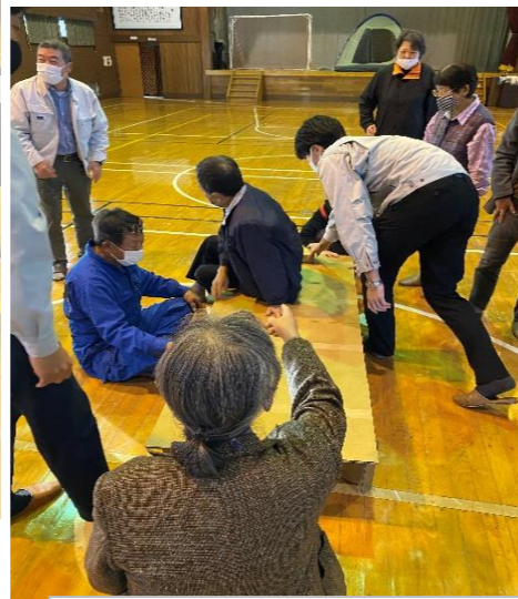
③上に平らなダンボールを乗せて簡易ベッドの出来上がり!