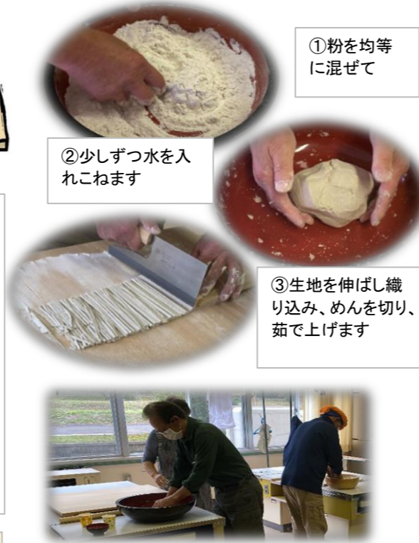
①粉を均等に混ぜて

南股地区センターでは、小規模でリクエスト講座を開催しています。皆さんからの要望で、いろいろと企画していきたいと思えます。皆さんからのリクエストをお待ちしています。