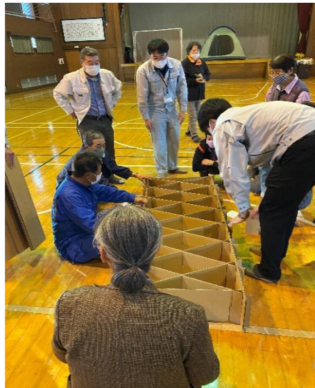
②それぞれ組み立てたら骨組みが出来上がり