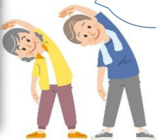
準備体操もパッチリ