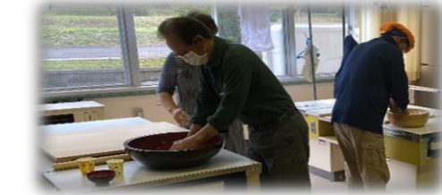
問い合わせ先 南股地区センター