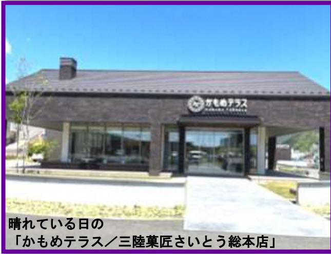
晴れている日の「かもめテラス／三陸菓匠さいとう総本店」

「コロナ禍になって初めて、4年ぶりとなる「おとなの遠足」を開催しました。参加者は14名。 6月9日(金)雨の中、大船渡・陸前高田方面へ行ってきました。 始めに、大船渡「かもめテラス」にて、集合写真(上の写真)を撮りました。その後、隣の商業施設「キャッセン大船渡」でお買い物や、昼食を楽しみました。 陸前高田では、「東日本大震災津波伝承館」を見学しました。 「奇跡の一本松」までは、雨風が強くなり、行く事を諦めた方もいたようでした。 天気は雨でしたが、皆さん思い思いにお買い物、見学等、楽しまれた様子で良かったです。