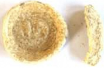
↑ 土師器(はじき)の小皿