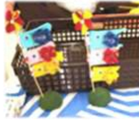
5月 こいのぼりを作りました