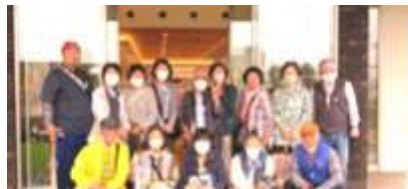
5月 大人の遠足 (大船渡・陸前高田方面へ)