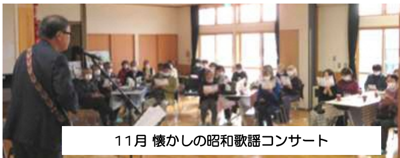
11月 懐かしの昭和歌謡コンサート