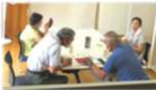
毎回 高齢者向けスマホ相談会