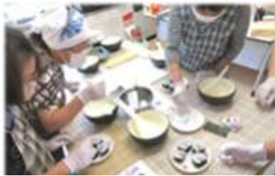
6月 飾り巻き寿司作り