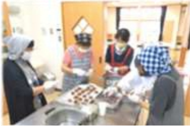
8月 まんじゅう作り

5月から3月までの第2、 第4月曜日に地区センターを 自由に使っていただく「開い てマンデー」を 行いました。