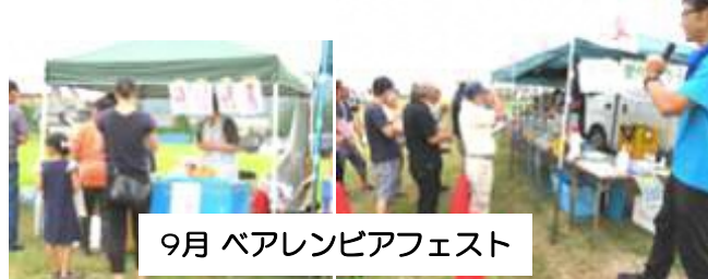
9月 ベアレンピアフェスト