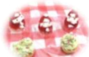
12月 クリスマスのお菓子作り

衣里地区振興会役員と専 門部員が10月リーダー研修 を行いました。 テーマは2つ、①災害の しくみを知り自然災害への 備えと防災対策を学ぶ。② 地域財産と地域振興を学 ぶ。として、一関の「あい ぽーと」「祭時大橋震災遺 構」「骨寺村荘園遺跡」の 3か所を視察しました。