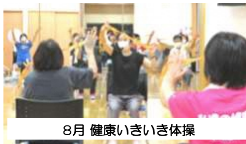
8月 健康いきいき体操