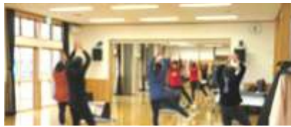
12月 ピンピンシャンシャン体操