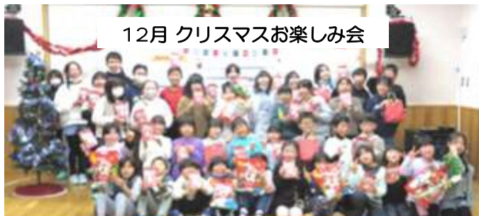
12月 クリスマスお楽しみ会