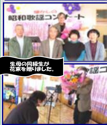
生母の同級生が 花束を贈りました。