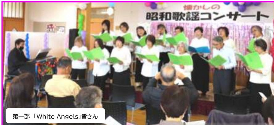
第一部 「White Angels」皆さん