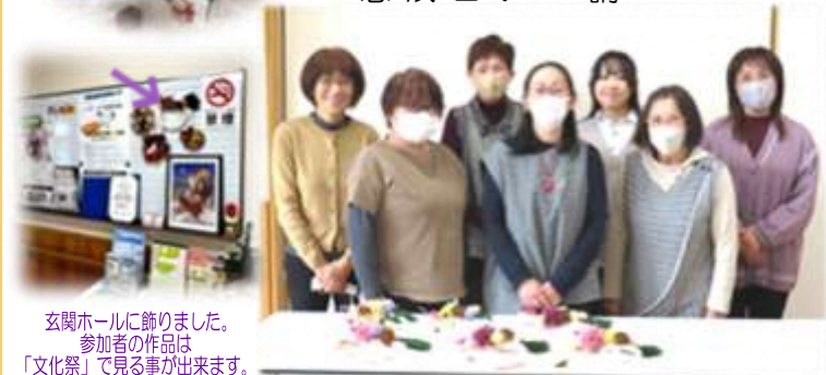
玄関ホールに飾りました。 参加者の作品は 「文化祭」で見ることが出来ます。