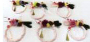
12月「しめ縄リース作り」