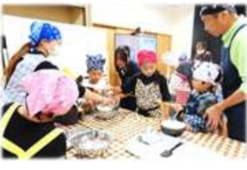
9月「かんづきを作ろう！」