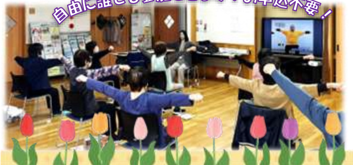
「いきいき百歳体操」は「よさってくらぶ衣里」の活動の一部です。