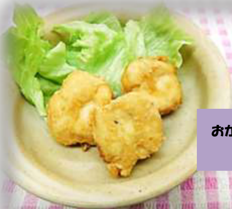
おからのから揚げ (江刺支部)