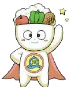
奥州市食育キャラクター「わんパッくん」