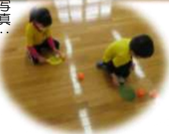
写真：「うまのドーナツ」

※3月1日（火）から当面の間、原則として、市民及び市内団体に限り利用できることとなりました。これまでに以上に感染防止対策の徹底をお願いいたします。