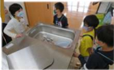
利用者さんにごあいさつ