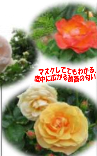
マスクしててもわかる、庭中に広がる薔薇の匂い!!