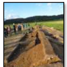
発掘で発見した箇所