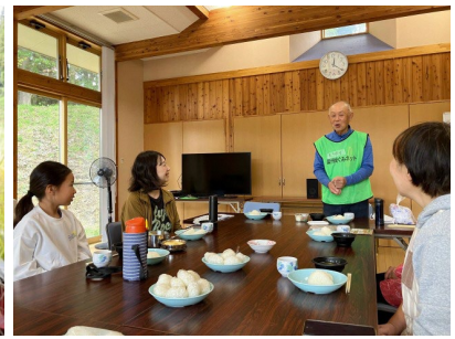
「買って食べるか？刈って食べるか？」