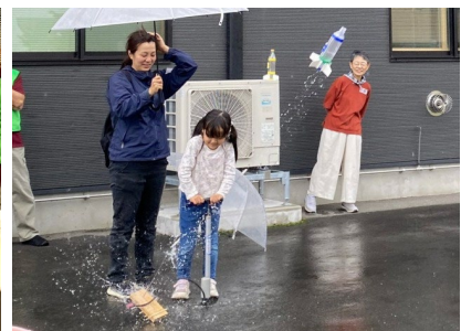
「リサイクル工作 中級編」