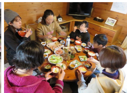
「ひまわりの魅力を探ろう」