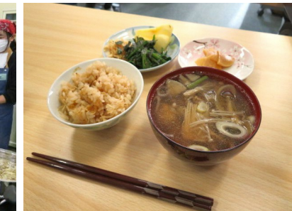
「やまば流 エコ楽クッキング」