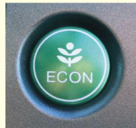
エコドライブスイッチの例

②エコドライブスイッチ * をONにしましょう。車の制御が変わって、ゆっくり加速しやすくなり、燃費が良くなります。