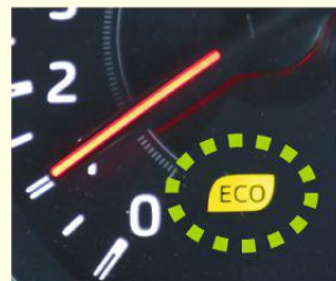
エコドライブランプの例

①エコドライブランプ * を点灯するように運転しましょう。アクセルをふんわり踏んで運転することになり、燃費が良くなります。