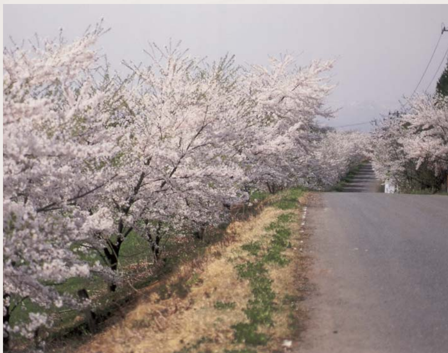
満開の時期はまさに桜の回廊となるサイクリングロード