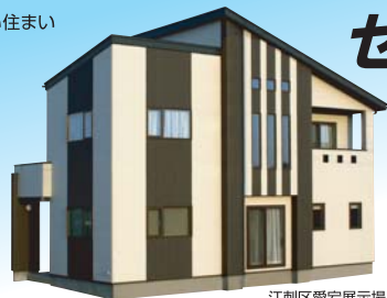
江刺区愛宕展示場