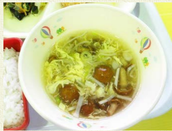
レシピ紹介：真城学校給食センター栄養教諭