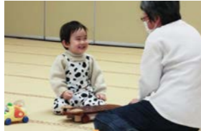
センターでの預かりの様子

のんびりとした癒やしの時間を過ごしてもらうために、「ファミカフェ」も開催しています。