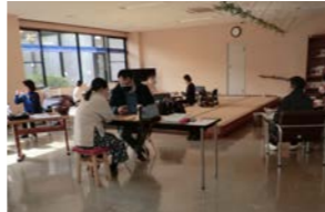
ファミカフェの様子