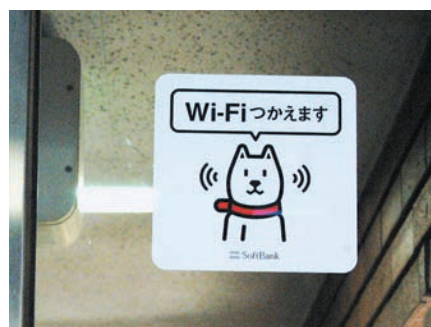
各施設の入り口にステッカーを貼付