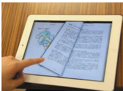
紙のように指でページをめくれます

市が発行する刊行物などを電子書籍化することで、住民が簡単に探せる、見られる、利用できる整備します。紙の書籍と違って、音声や動画などの情報も掲載することが可能となります。2013年に公開予定です。 ※写真は試作品です