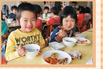
東水沢保育園のみんな

悪質商法被害にあわないために Q 最近、高齢者を狙った振り込め詐欺や悪質商法が多く、不安な毎日を送っています。高齢者がトラブルに巻き込まれないように、老人クラブなどで教えてもらえませんか。 （市内60代男性）