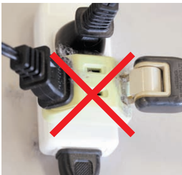
たこ足配線やコンセントにたまったほこりも火災の原因に。ご注意ください！