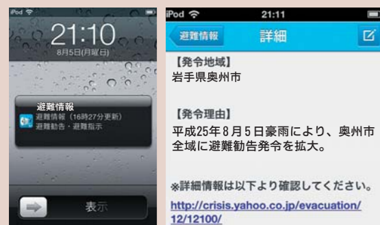
【図2】 スマートフォン向けアプリの表示例

奥州市を地域登録すると、Yahoo! JAPAN トップページに市内の避難情報が表示されます