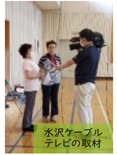
水沢ケーブル テレビの取材