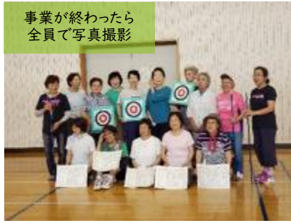
事業が終わったら 全員で写真撮影