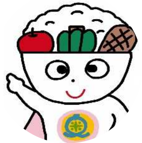
奥州市食育キャラクター わんパッくん