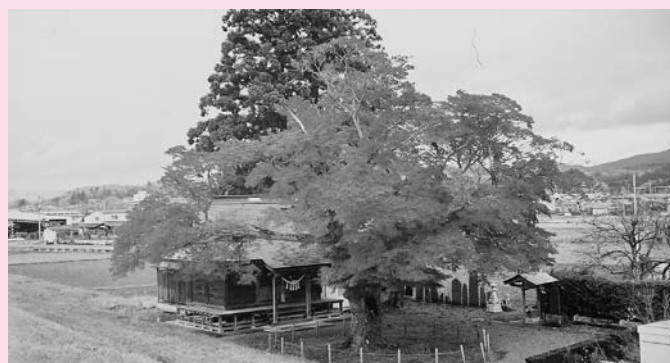
市指定天然記念物・羽田町イロハモミジ（水沢区）

市指定天然記念物・水沢区羽田町内栗ノ瀬イロハモミジ樹勢回復対策について伺います。イロハモミジの自生は福島県以西で、北限のイロハモミジとして浜松市の研究者がインターネットにより紹介され、NHKの取材問合せがあり見学者が訪れます。