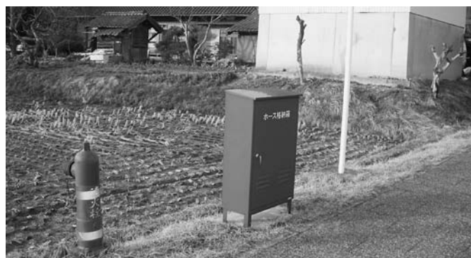
消火栓とセットに設置されているホース格納庫（衣川区）

STEMによって行っております。 平成18年10月1日から消防本部司令室が一元化した以降、江刺区と胆沢区においては、消防本部無線を傍受できない状況にありますので、今後の対応については、当面の間の必要な措置を早急に実施してまいります。