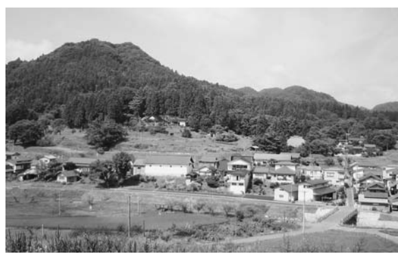
バイパスを期待する梁川字館下地内（江刺区）

「道の駅」は、設置の可能性はあります。107号線の直近は錦秋湖であり、距離条件でも問題はありませんが、情報発信機能と地域連携機能に独自色を持たせる工夫が必要です。県との事前協議や地域との意見交換を通じて可能性を探り、独自色ある内容の具体