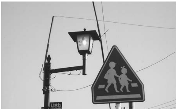
国道397号線沿いの街路灯（胆沢区）

質問 街路灯とは、広義では街灯全般を指し、狭義では防犯灯などのデザイン性を高めた街灯のことです。安全・安心なまちづくりには欠かせないものであります。胆沢区では、設置して20年も経過