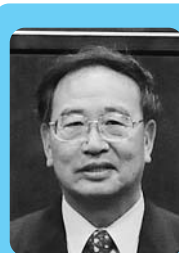
ちば ごろう 千葉 悟郎

質問 「胆沢平野の開拓の祖」と言われる「後藤寿庵」は、1600年代の前半に、用水路（寿庵堰）を掘り、現在の穀倉地帯の基礎をなした人として尊敬し続けられて来ております。伊達政宗より赴任の命令を受けた1611年から、まもなく「400年」（2011年）になろうとしています。「三偉人の顕彰事業」と同様、教育委員会として積極的に取り組む考えはないのか伺います。