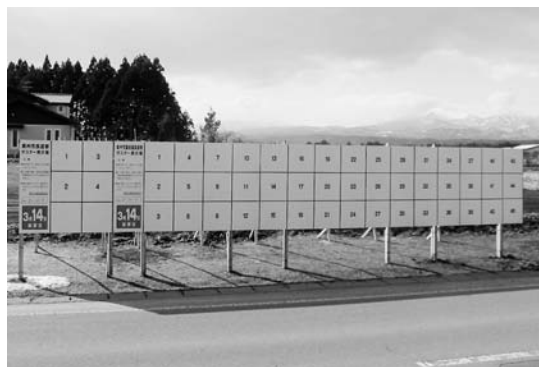
選挙ポスター掲示板

市長 掲示板、設置費用、撤去費用等が1790万円、ポスター作成費用1930万円の計3720万円です。ポスター掲示は立候補者の情報を有権者に伝えることや選挙啓発にもなります。ポスター掲示に関する住民意向を、参議選のあと聞き取りをして参考にしてまいります。