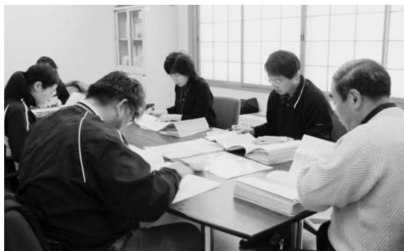
厳正な審査が行われている介護認定審査会

なっているのではないかと伺います。 市長 これまで個人情報保護の過度な状況は否めません。民生委員には守秘義務があり、情報提供は問題ないものと思います。今後民生委員協議会と協議の上、仕事がいりやすくなるよう検討してまいります。