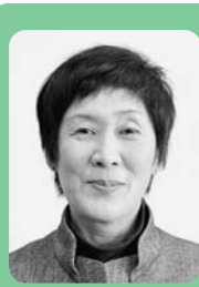
せき かん しょうこ 子 関

〇〇本庁と総合支所のあり方について 子供や孫達に奥州市に存在する膨大な借金を残さない為の方策について