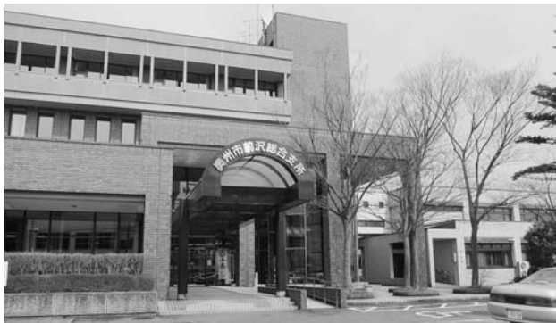
奥州市前沢総合支所

市長 総合支所方式は合併協議で10年間は置く事とされており、合併来188名の職員が減っており総合支所は4割の減となっております。厳しい財政事情ではあり