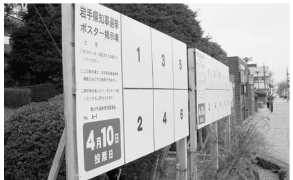
経費削減のため94ヶ所減少されたポスター掲示場