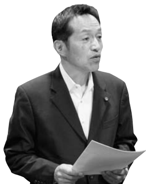
飯坂 一也 議員(公明党)