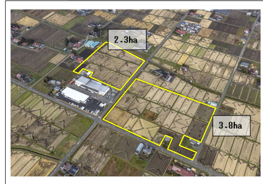
広表工業団地区域航空図