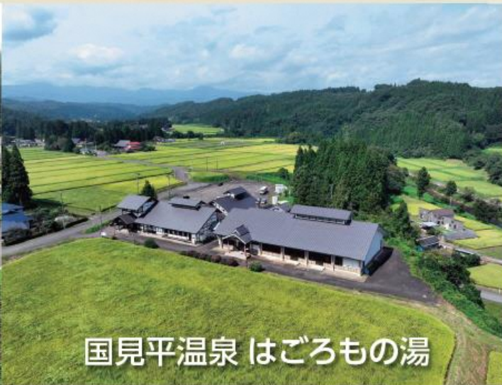
国見平温泉 はごろもの湯