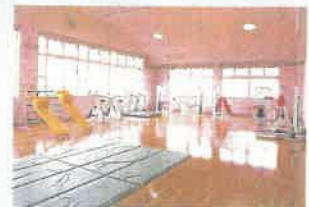
トレーニング室 健康体育器機10種類設置