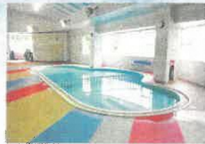
温水プール 幼児用プール

えさしクリーンパークは、隣接する「いわてグリーンセンター」の建設に併せて整備された、温水プールや入浴施設を備えたスポーツレクリエーション施設です。 一年を通して皆様の健康増進、安らぎの場としてご利用いただける多目的パークです