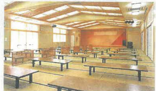
和室休憩室 風呂あがりは大広間でゆっくり。