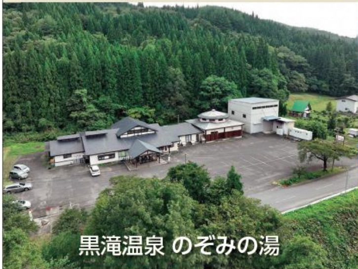
黒滝温泉 のぞみの湯