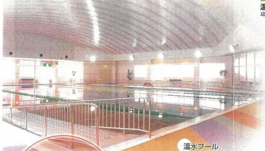
温水プール 25mプール