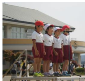
1年はじめのことば

保護者の皆様には当日までの体調管理や競技の準備ありがとうございました。また、最後の後片付けにも御協力いただきました。本当にありがとうございました。