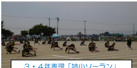
3・4年表現「姉小ソーラン」