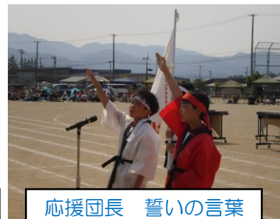
応援団長 誓いの言葉