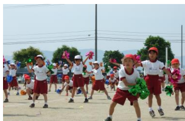
1・2年ダンス「やってみよう」