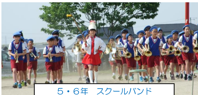
5・6年 スクールバンド

5月21日(土)、青い空のもと運動会を開催することができました。お忙しい中、足を運んでいただき、子ども達に声援を送っていただきました。ありがとうございました。おかげさまで子供たちはたくさんの方々に見てもらえるうれしさと楽しさを感じながら、一生懸命競技に取り組むことができました。