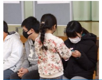
1年生からプレゼント

各学年の発表の終わりに「6年生からの〇〇対決」がありました。けん玉リレー・九九・なわとび・二人三脚・むかで競走など競い合いました。後輩を楽しませようと考えた6年生の温かさに感激しました。そして、後輩たちに「がんばれ！」「たのんだぞ！」の励ましを心から送ってくれました。