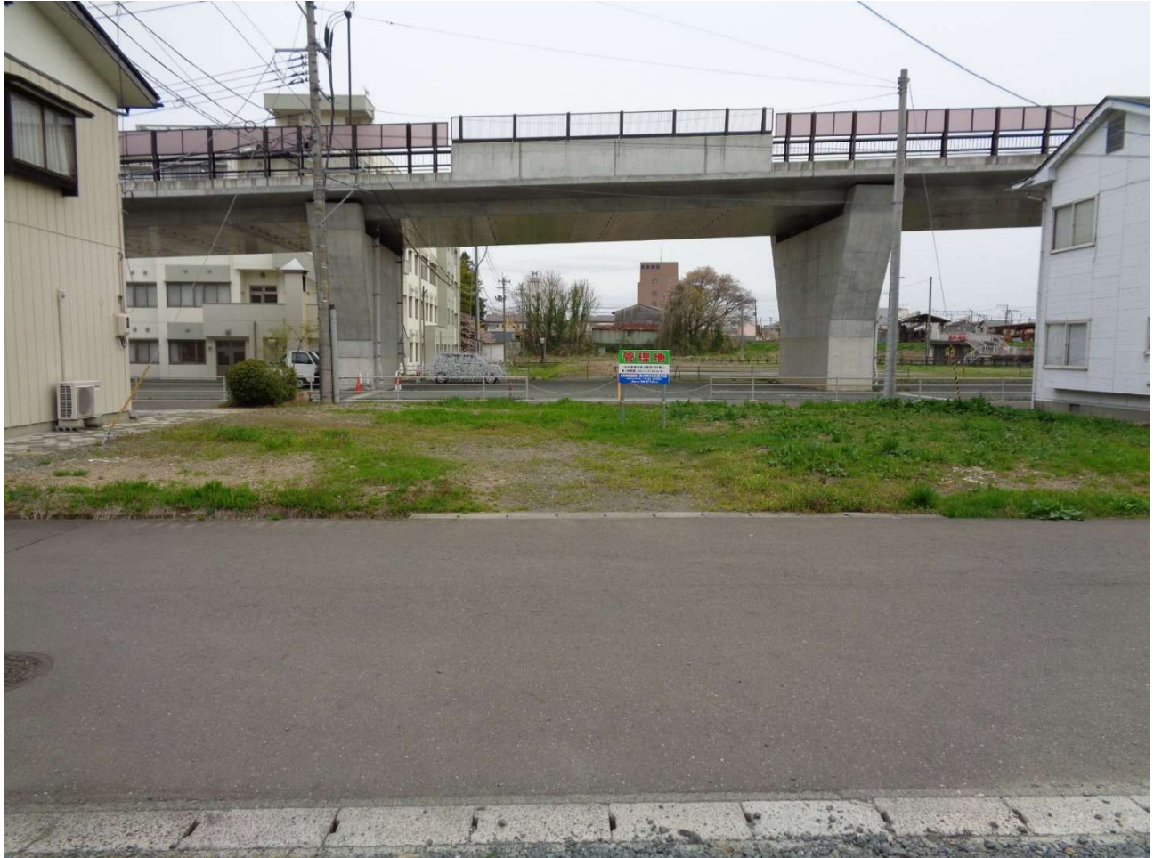
(敷地の北側市道から撮影)