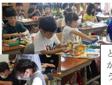
どう かざろ うかな