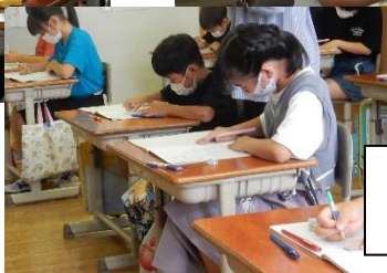
どう計算 しようかな