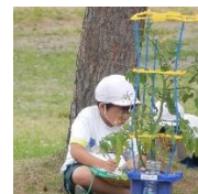
生長したところは…