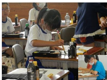
書写の学習 一画一画 ていねいに