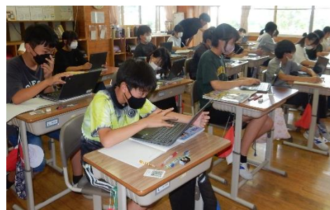
タブレットで調べ学習